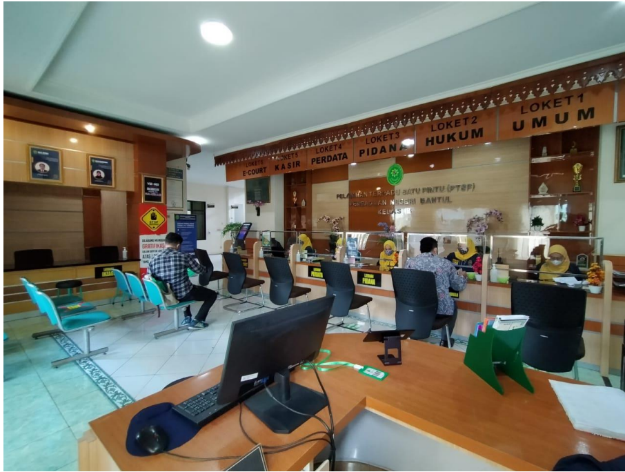
Ruang tunggu PTSP