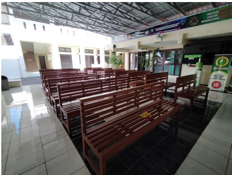
Ruang tunggu persidangan