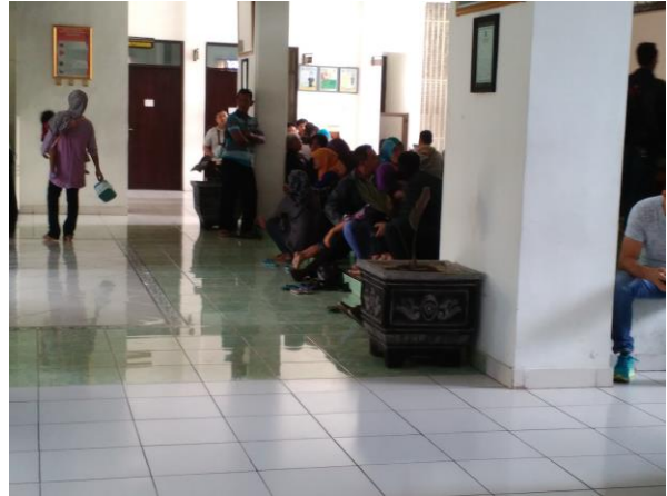
Terjadi penumpukan pengunjung