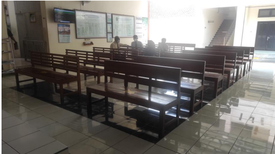
Ruang tunggu persidangan

Manfaat yang diperoleh dari pemisahan ruang tunggu: