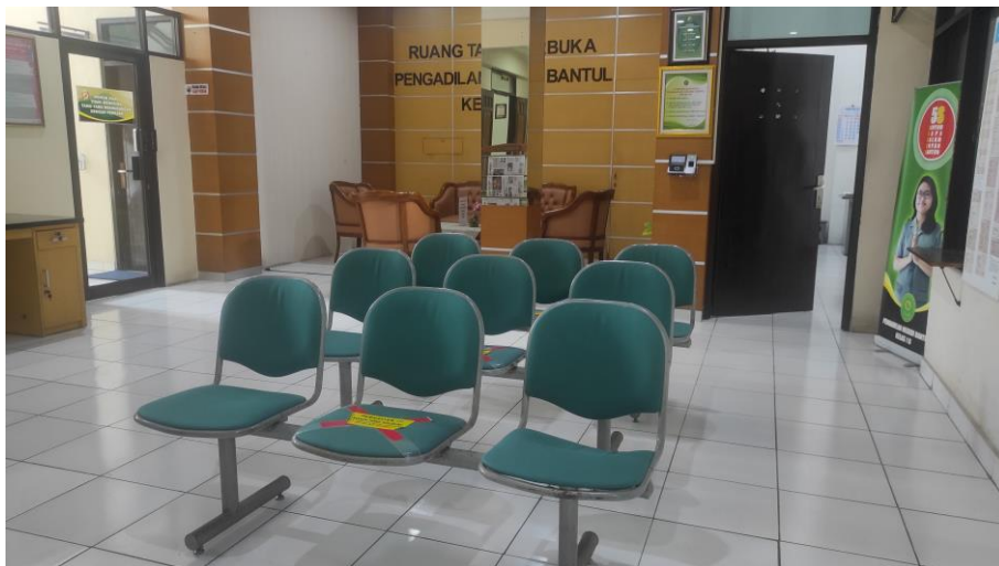
Ruang tunggu PTSP