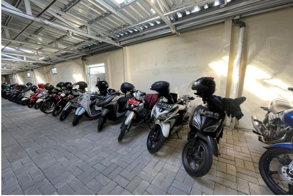
Parkir Kendaraan Roda 2 Pegawai