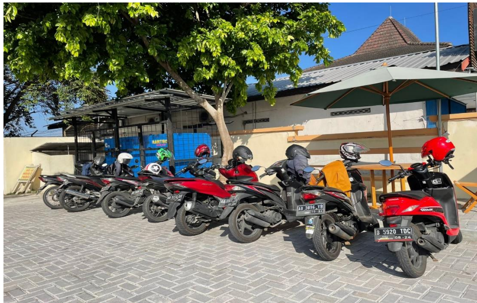
Parkir Kendaraan Roda 2 Pengunjung / Tamu