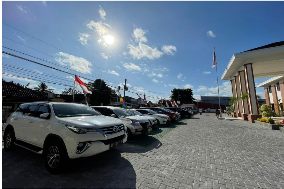
Parkir Kendaraan Roda 4 Pengunjung / Tamu