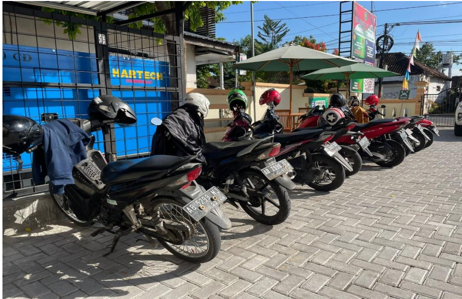
Parkir Kendaraan Roda 2 Pengunjung / Tamu