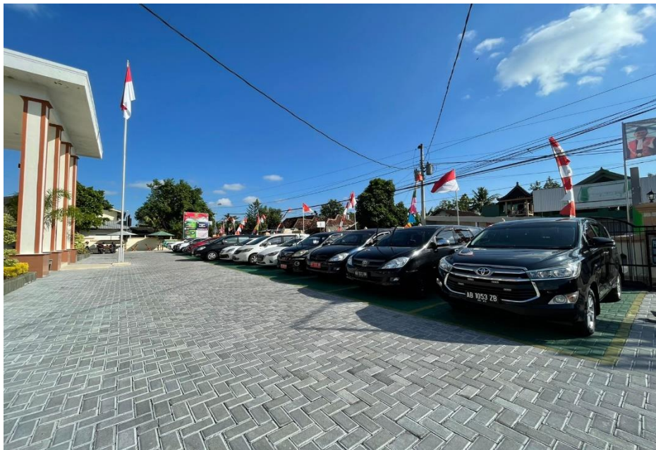
Parkir Kendaraan Roda 4 Pengunjung / Tamu