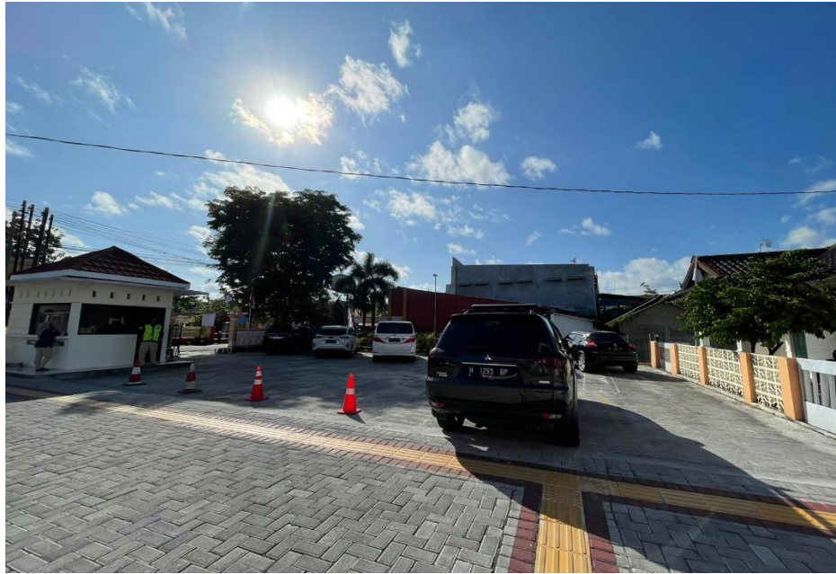
Parkir Kendaraan Roda 4 Hakim dan Pegawai