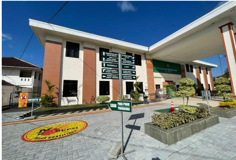
Papan Penunjuk Arah Parkir Kendaraan