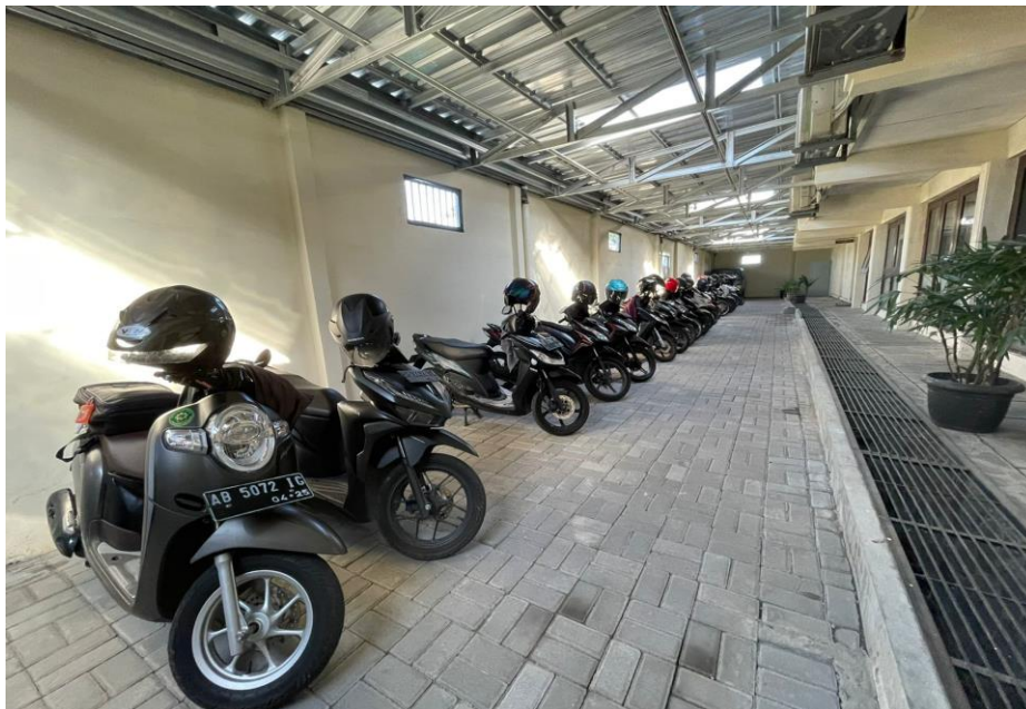
Parkir Kendaraan Roda 2 Pegawai