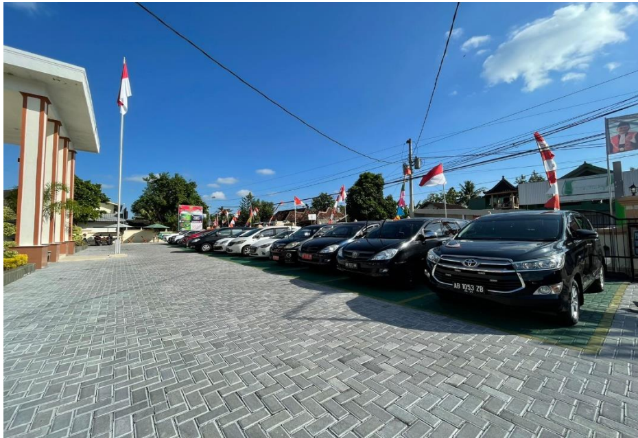
Parkir Kendaraan Roda 4 Pengunjung / Tamu