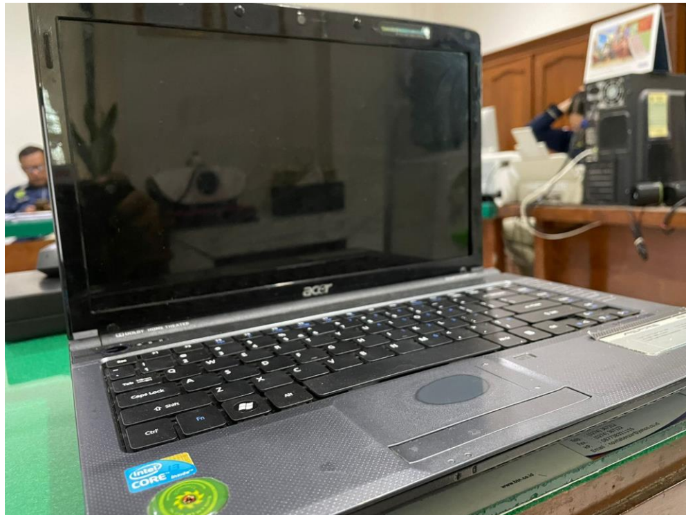
LAPTOP ACER PIDANA