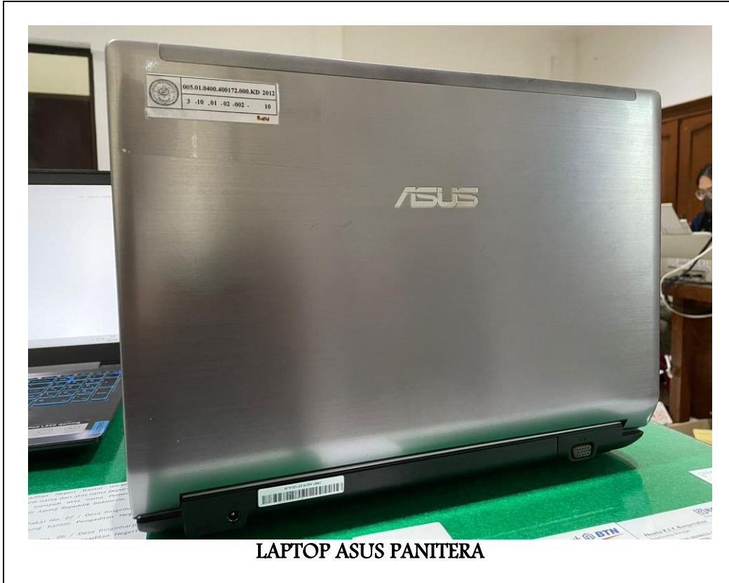
LAPTOP ASUS PANITERA