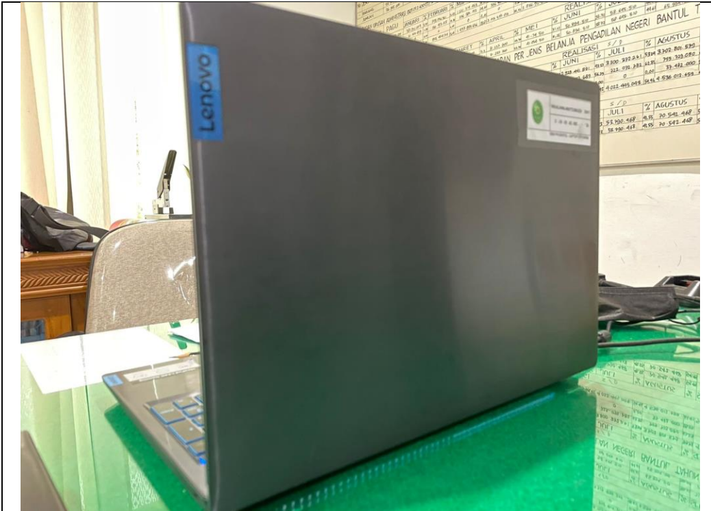
LAPTOP LENOVO KASUBBAG UMUM & KEUANGAN