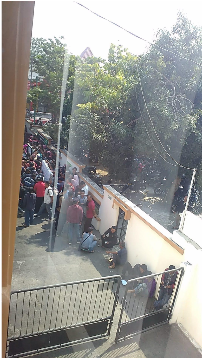
Foto kerumunan pelanggar yang ingin melihat denda di papan

Pelanggar yang ingin mengetahui besaran denda tilang datang ke pengadilan pada hari dan jam-jam yang sama sehingga terjadi penumpukan