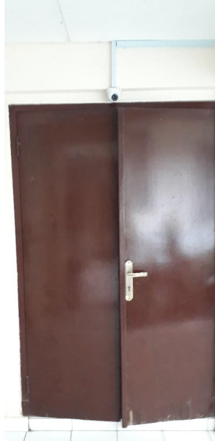
Cctv Area Lorong

PENGADILAN NEGERI BANTUL KELAS I B Jl. Prof. Dr. SOEPOMO, S.H. No. 4 BANTUL – DIY 55711 Telp/Faks: 0274 – 367348, Laman: www.pn-bantul.go.id Pos-el: surat@pn-bantul.go.id