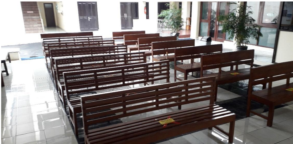
Ruang tunggu sidang