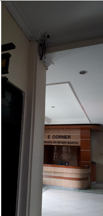
Area Ruang Masuk / Lobby Depan / cctv arah PTSP