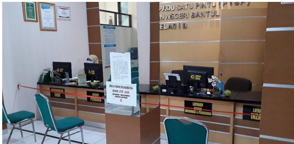
Area Pelayanan Terpadu Satu Pintu (PTSP) terpasang cctv