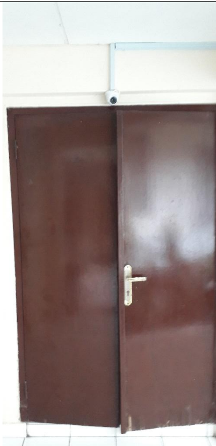
Cctv Area Lorong

PENGADILAN NEGERI BANTUL KELAS I B Jl. Prof. Dr. SOEPOMO, S.H. No. 4 BANTUL – DIY 55711 Telp/Faks: 0274 – 367348, Laman: www.pn-bantul.go.id Pos-el: surat@pn-bantul.go.id