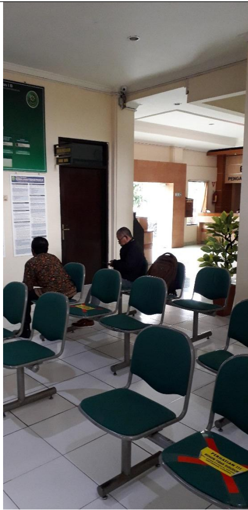
Ruang tunggu PTSP