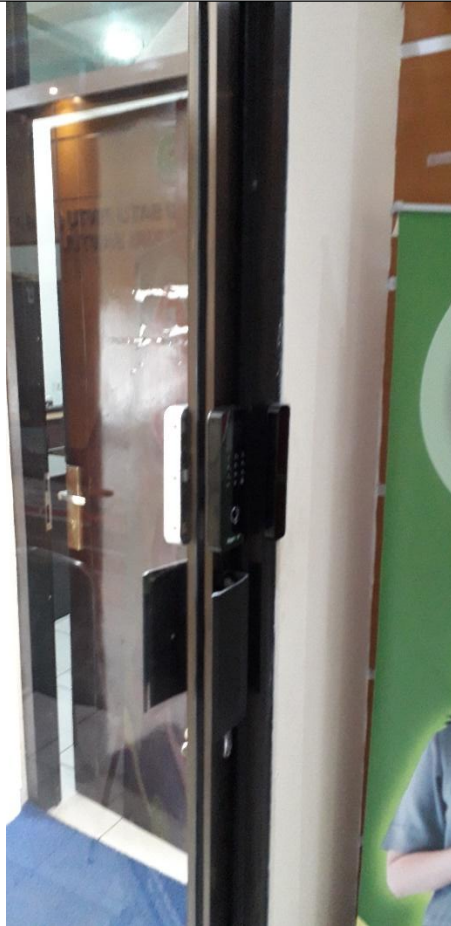
Area Steril pada Pengadilan Negeri Bantul