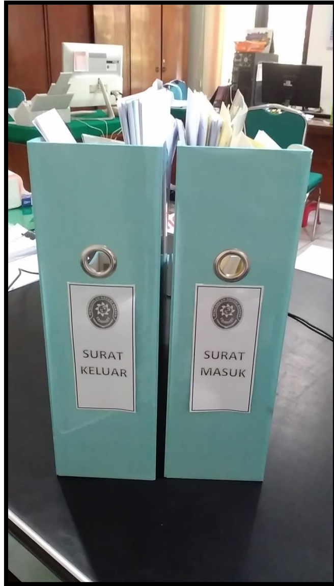
Foto file box penyimpanan surat