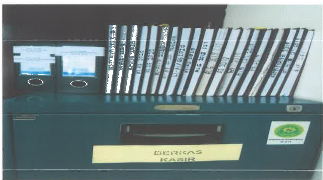
Buku Register merupakan salah satu sarana penunjang kinerja yang digunakan secara terus menerus.