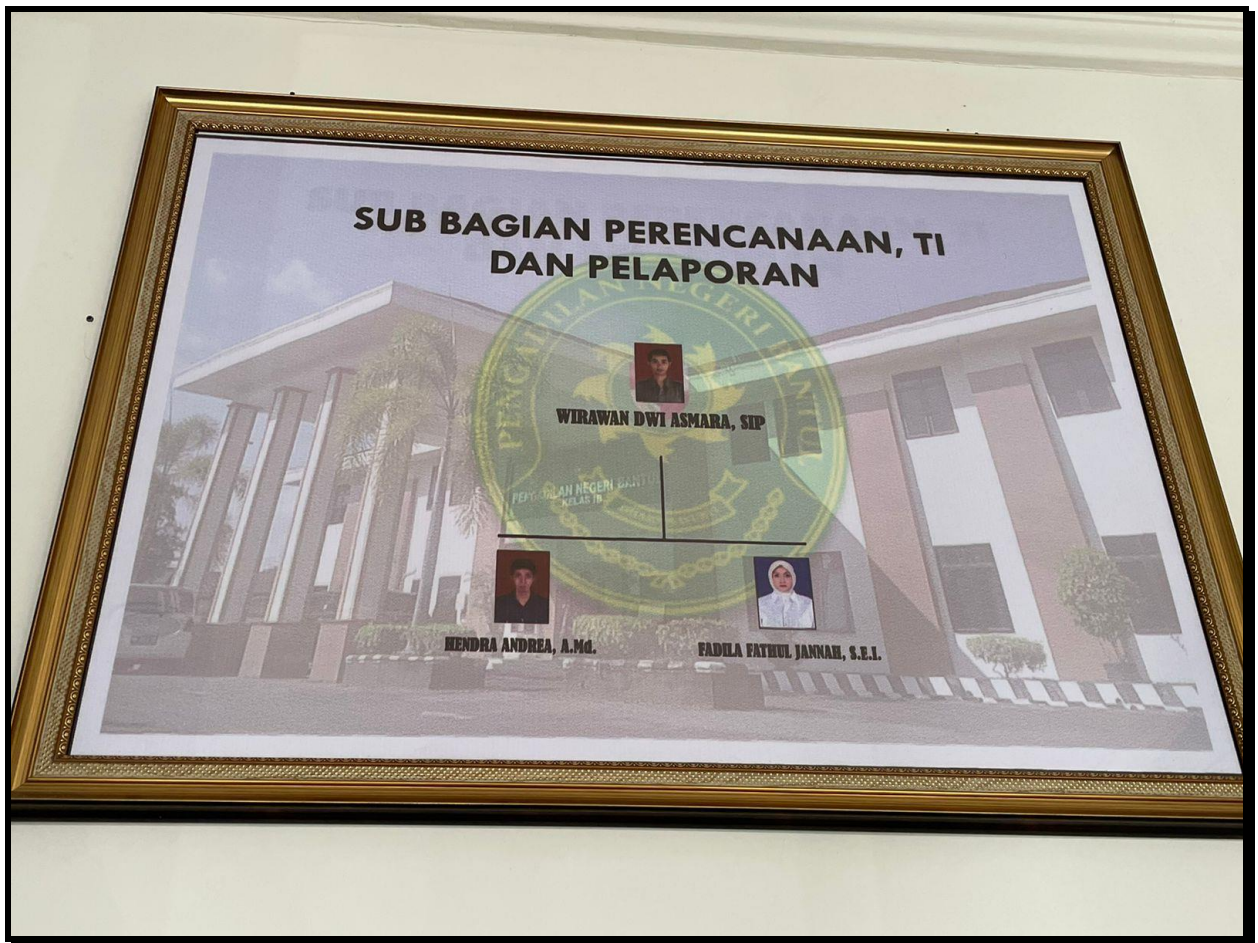
Foto: bagan struktur pegawai PTIP