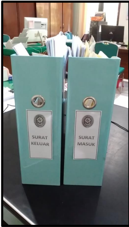
Foto file box penyimpanan surat