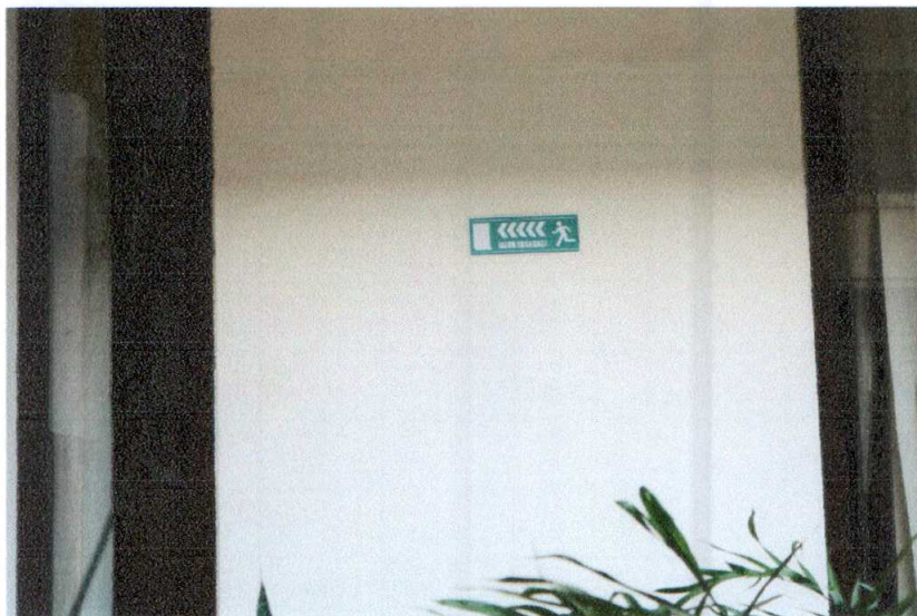
Persediaan DIPA 01