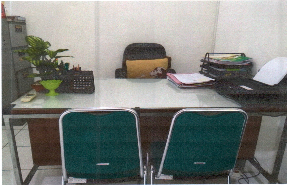
Ruangan pada saat datang

setiap pegawai pada saat datang dan sebelum pulang harus merapikan dan menyimpan berkas kerja di tempat yang telah disediakan