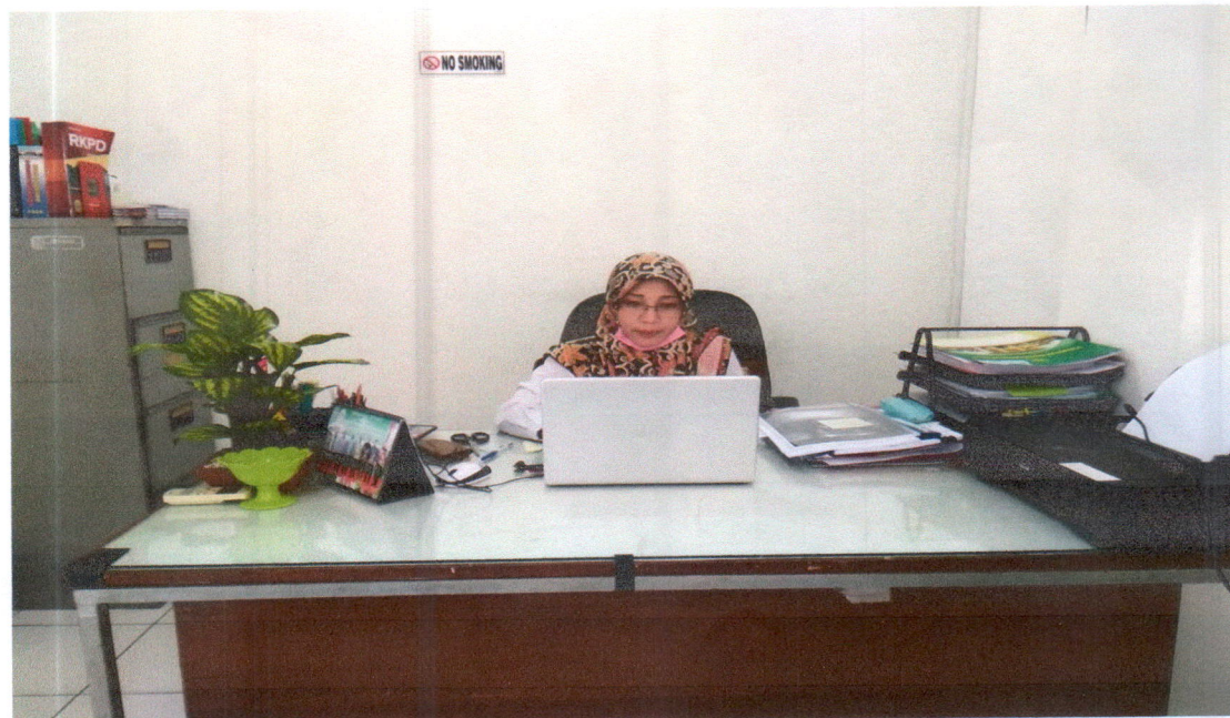
Ruangan pada saat jam kerja