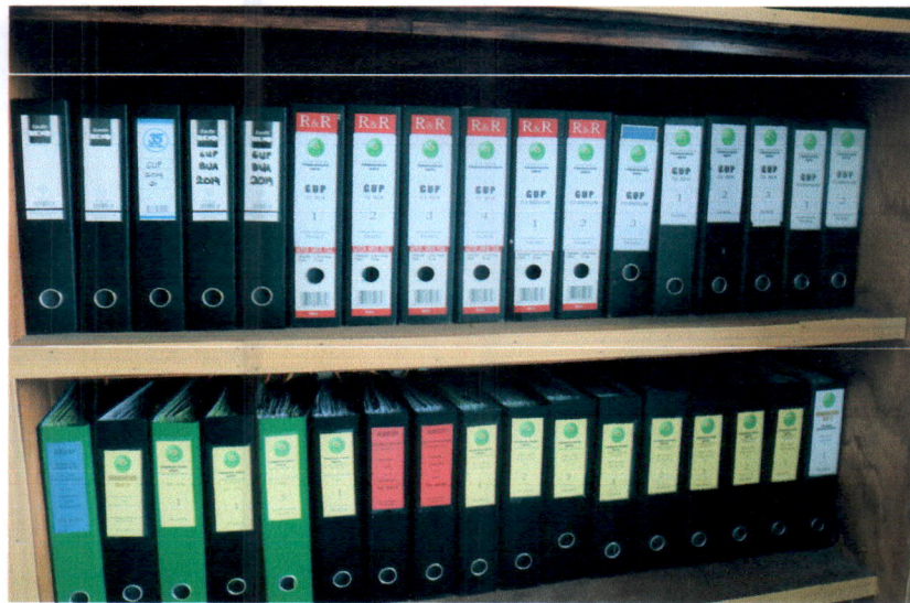
Arsip Umum dan Keuangan