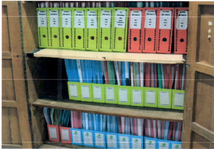
Arsip Umum dan Keuangan

1. Penyimpanan barang alat sesuai tempat yang telah ditentukan dan sudah diberi label