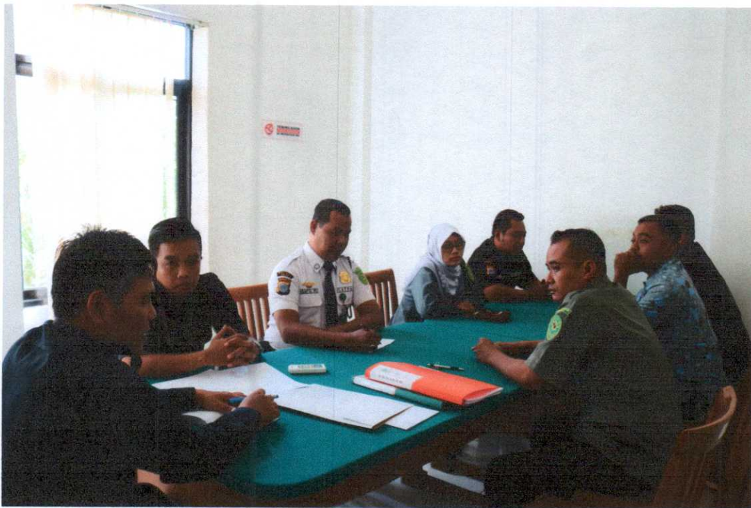
Rapat Evaluasi Honorer Triwulan I TAHUN 2019 Ruang Rapat PN Bantul, Senin 1 April 2019