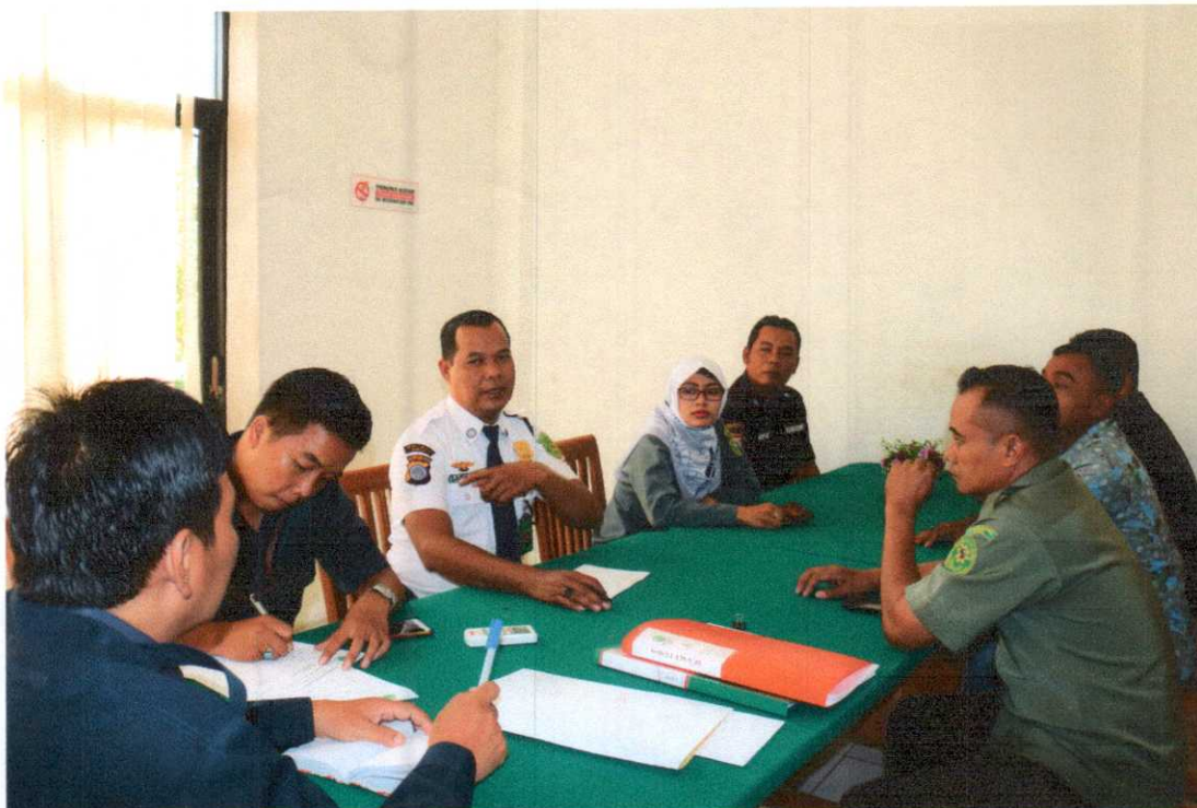
Rapat Evaluasi Honorer Triwulan I TAHUN 2019 Ruang Rapat PN Bantul, Senin 1 April 2019