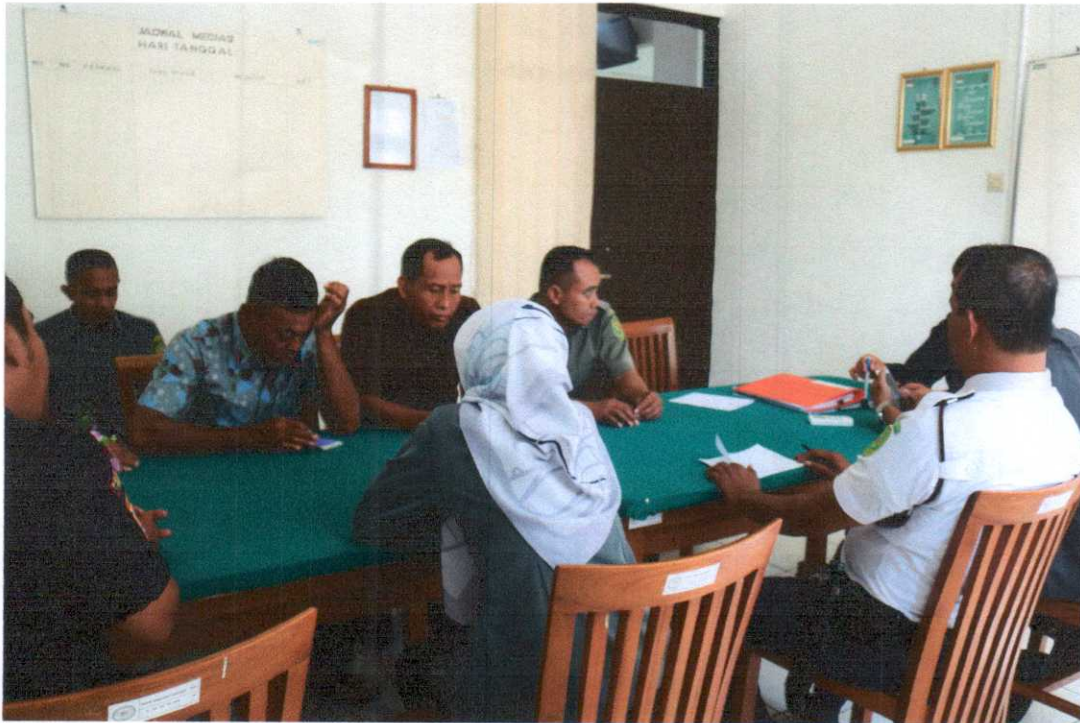
Rapat Evaluasi Honorer Triwulan I TAHUN 2019 Ruang Rapat PN Bantul, Senin 1 April 2019