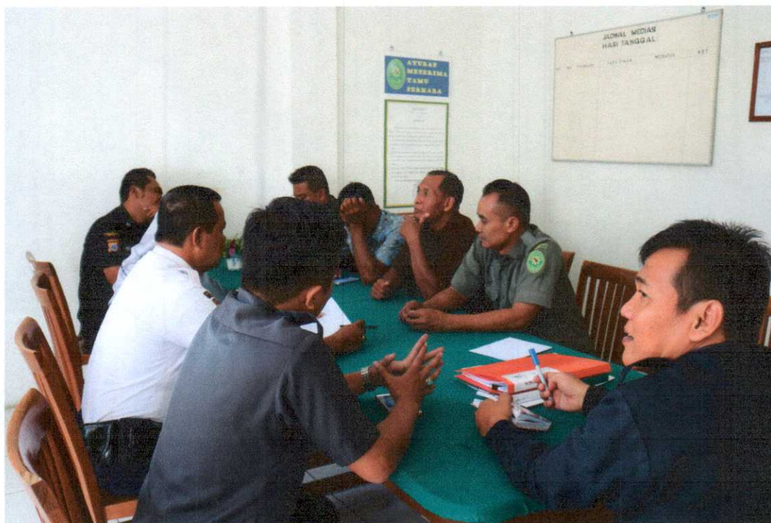
Rapat Evaluasi Honorer Triwulan I TAHUN 2019 Ruang Rapat PN Bantul, Senin 1 April 2019