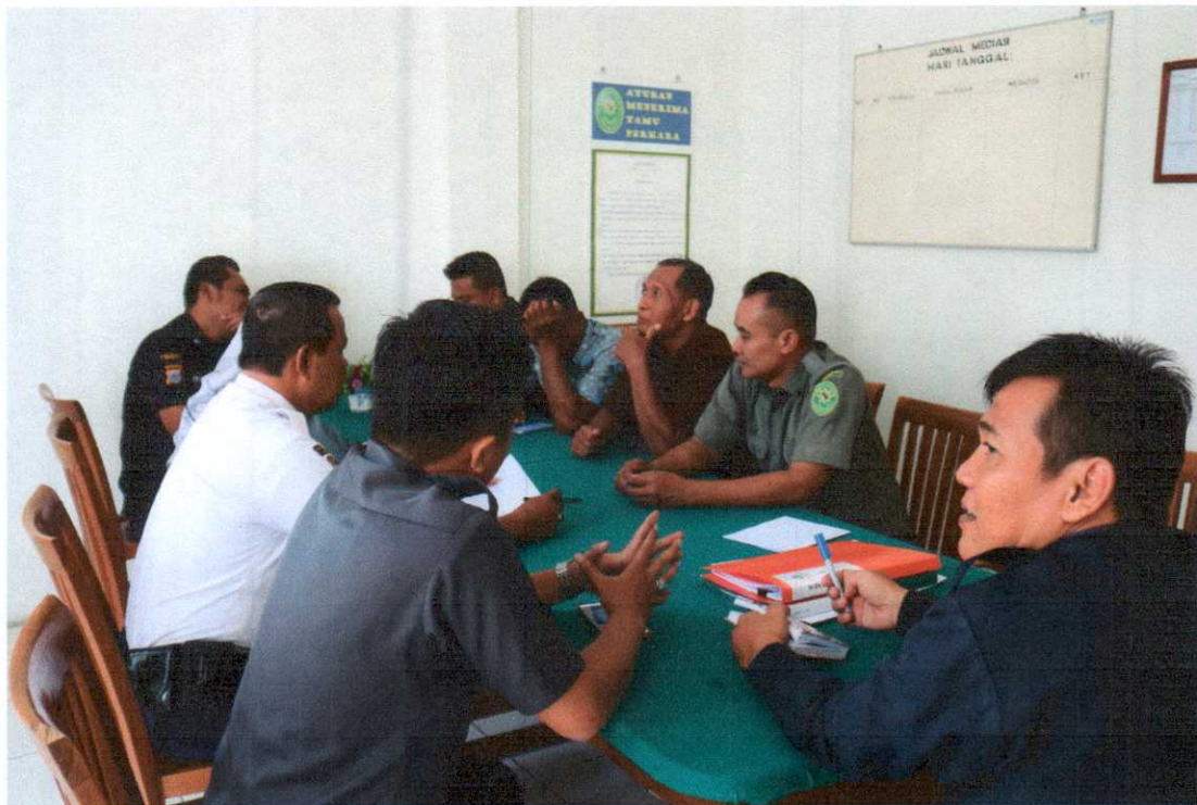
Rapat Evaluasi Honorer Triwulan I TAHUN 2019 Ruang Rapat PN Bantul, Jum'at 29 Maret 2019