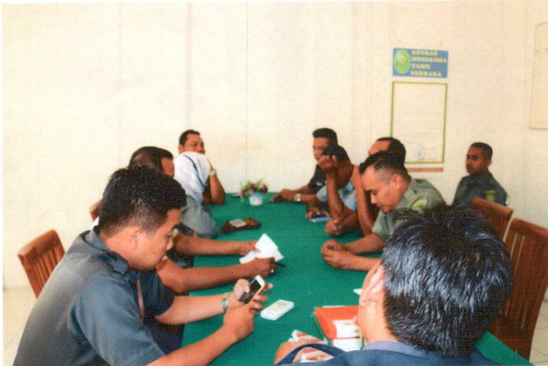
Rapat Evaluasi Honorer Triwulan I TAHUN 2019 Ruang Rapat PN Bantul, Senin 1 April 2019