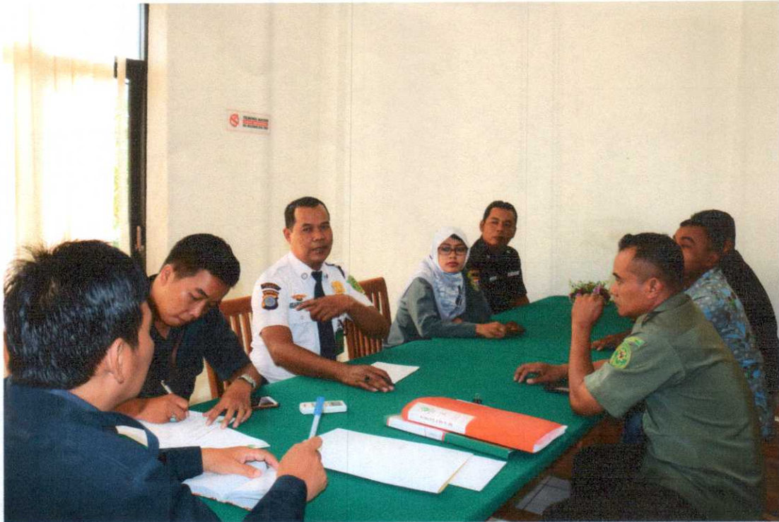
Rapat Evaluasi Honorer Triwulan I TAHUN 2019 Ruang Rapat PN Bantul, Jum'at 29 Maret 2019