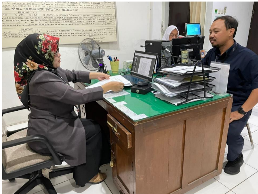
Foto Pengawasan Hawasbid Umum dan Keuangan