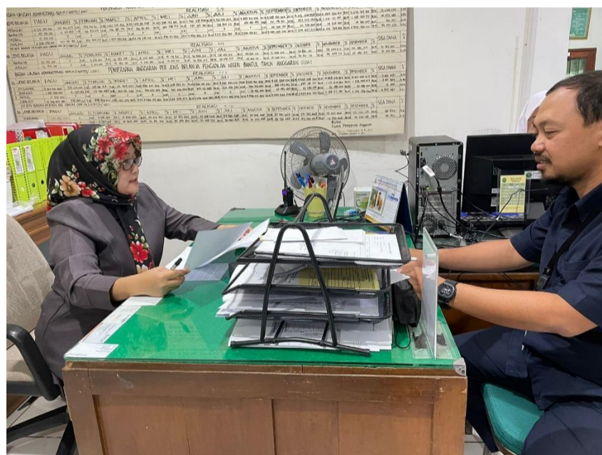
Foto Pengawasan Hawasbid Umum dan Keuangan