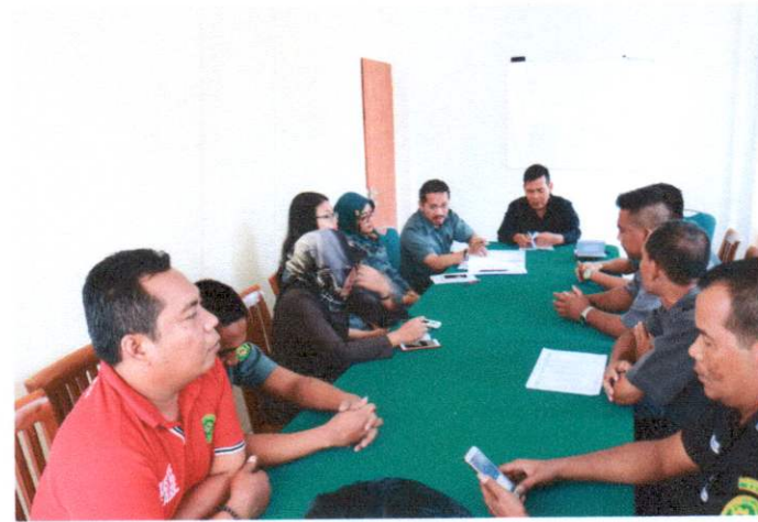
R. Rapat PN Bantul, Selasa 8 Oktober 2019