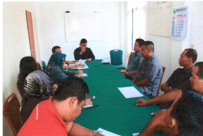
R. Rapat PN Bantul, Selasa 8 Oktober 2019