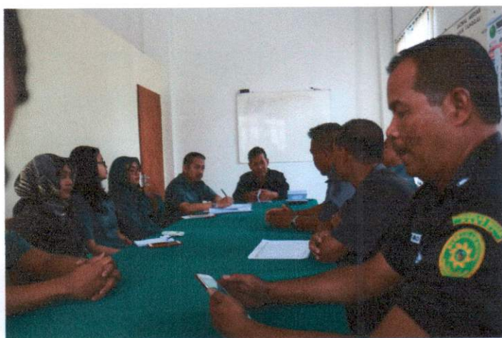
R. Rapat PN Bantul, Selasa 8 Oktober 2019