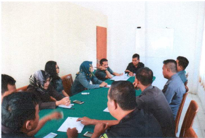
R. Rapat PN Bantul, Selasa 8 Oktober 2019