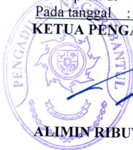
ALIMIN RIBUT SUJONO