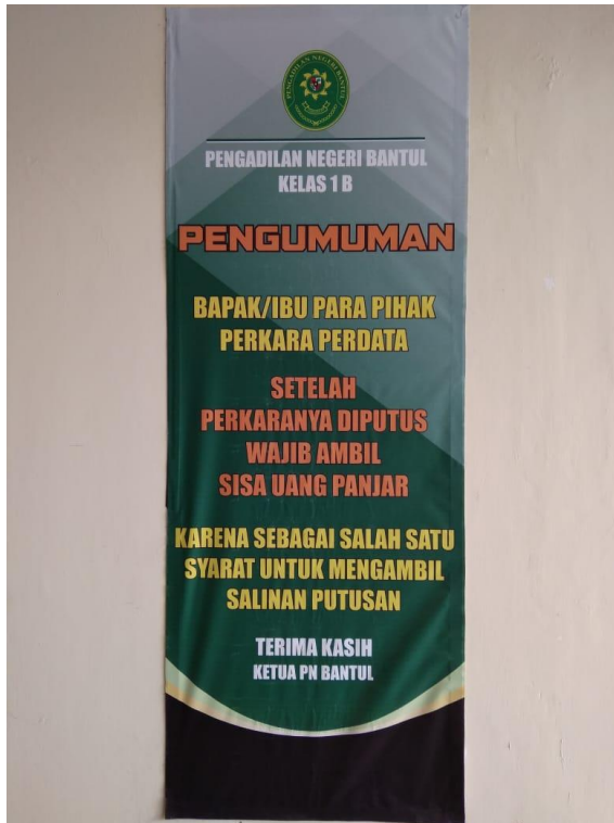
Banner pengambilan sisa panjar